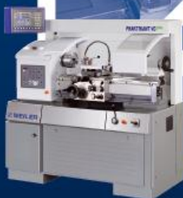
Konventionelle Präzisionsdrehmaschine Praktikant VC P46